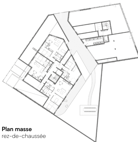
Plan masse rez-de-chaussée