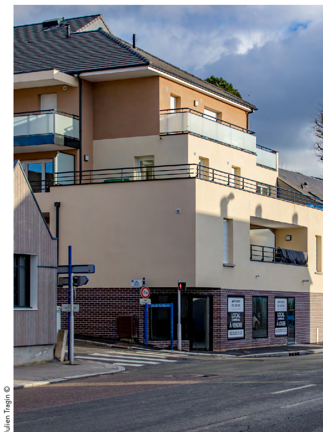
Le clos des tisserrands - Déville Les Rouen