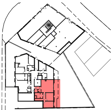
Plan de repérage appartement A_001