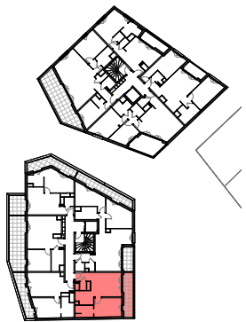
Plan de repérage appartement A_202