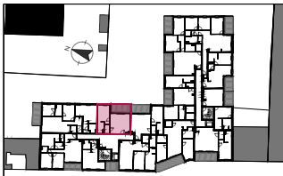
Plan de repérage / R+2 Appartement A203