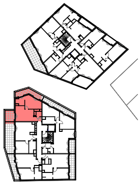
Plan de repérage appartement A_205