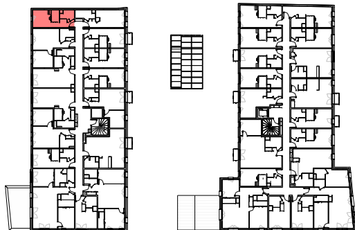
Plan de repérage appartement A-206