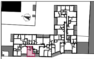
Plan de repérage / R+2 Appartement A207