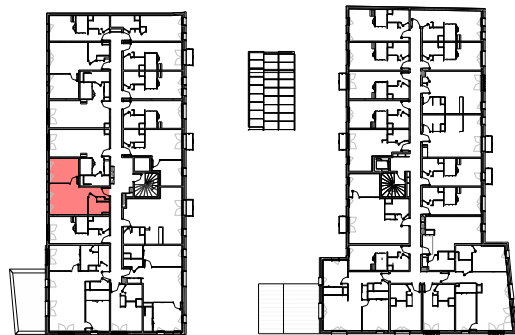
Plan de repérage appartement A-210