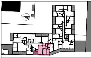
Plan de repérage / R+3 - Attique Appartement A301