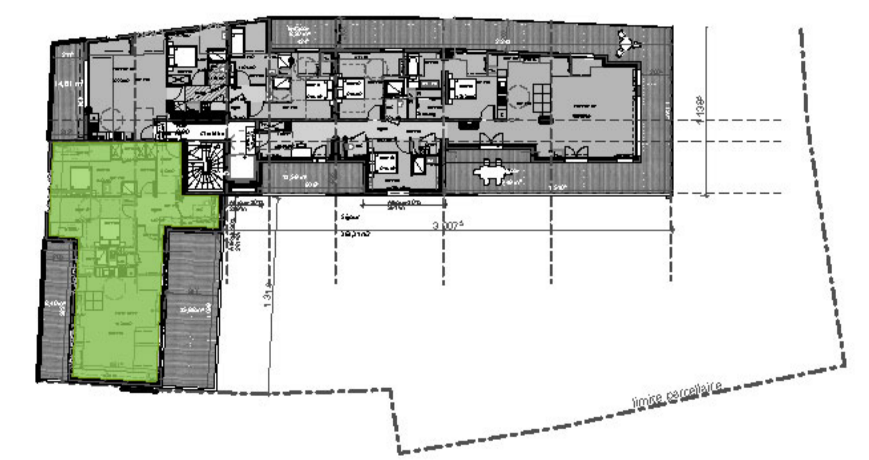
ETAGE - R+3