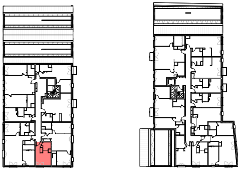
Plan de repérage appartement A-305