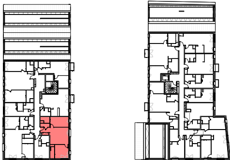
Plan de repérage appartement A-306