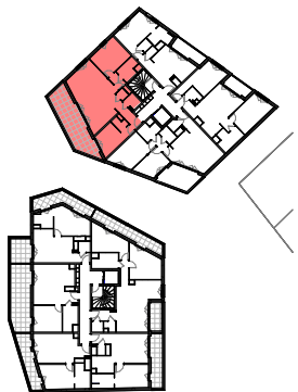
Plan de repérage appartement B_204