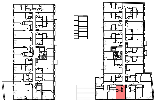
Plan de repérage appartement B-204