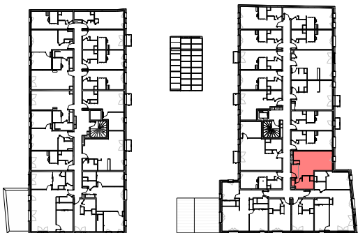
Plan de repérage appartement B-207