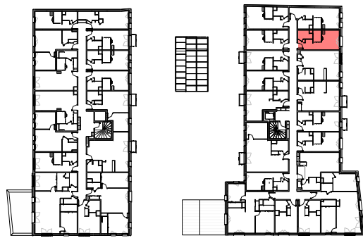
Plan de repérage appartement B-212