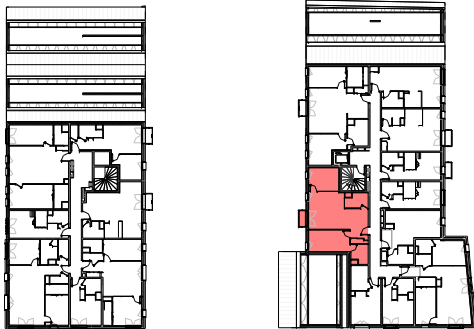
Plan de repérage appartement B-301