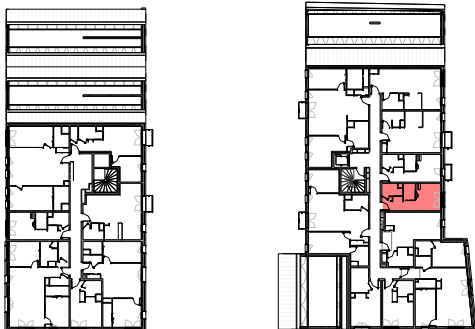
Plan de repérage appartement B-306