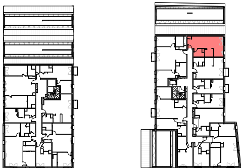
Plan de repérage appartement B-309