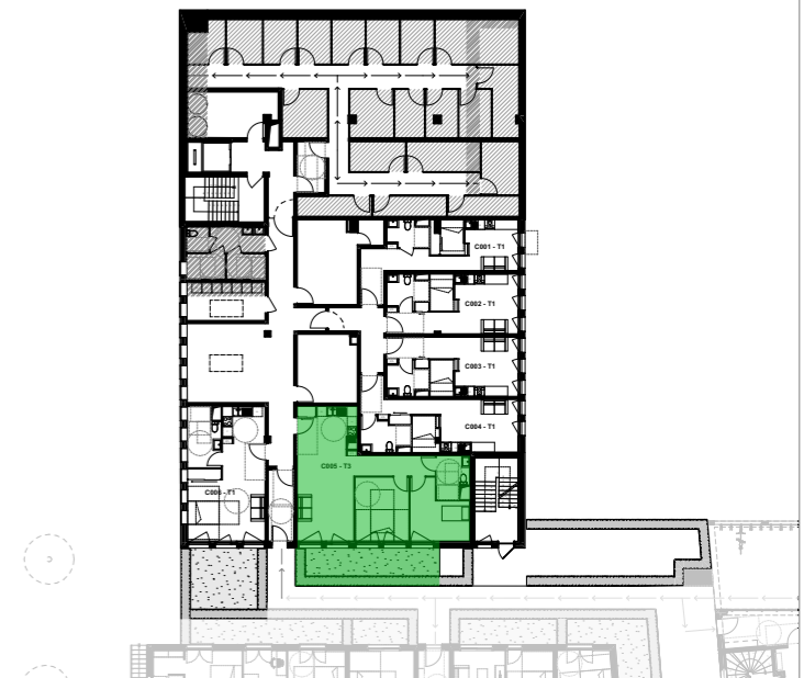
PLAN D'ETAGE ET LOCALISATION