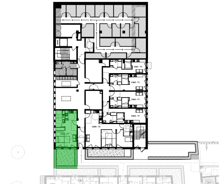
PLAN D'ETAGE ET LOCALISATION