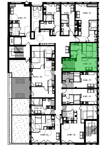
PLAN D'ETAGE ET LOCALISATION