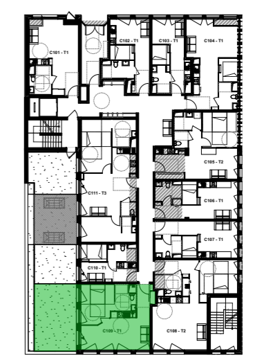
PLAN D'ETAGE ET LOCALISATION