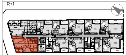
TABLEAU DE SURFACE | surface habitable (m²)