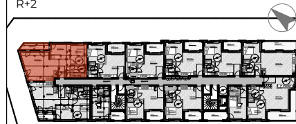
TABLEAU DE SURFACE | surface habitable (m 2 )