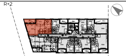
TABLEAU DE SURFACE | surface habitable (m 2 )