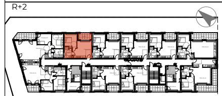
TABLEAU DE SURFACE | surface habitable (m²)